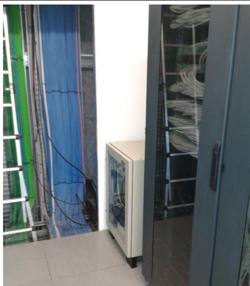
Armadio contenente il ricevitore ed il gruppo UPS